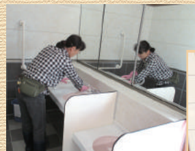
夢公園トイレ清掃