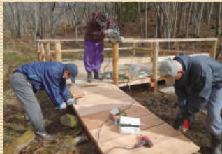
観賞用デッキ造り