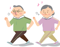
百歳体操をする会員のみなさん