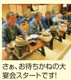
さあ、お待ちかねの大宴会スタートです!