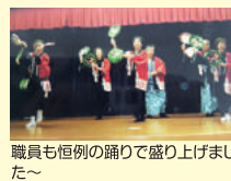
職員も恒例の踊りで盛り上げました～