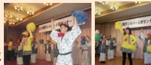
年寄りだらけのヤングマン！

大宴会、今回も半端ない盛り上がりでお開きとなりました！呑み足りない人や歌い足りない人は夜な夜なラウンジへ・・・小腹が空いた人はラーメン屋さんへ・・・寝る前にもう一度温泉につかりたい人は浴場へ・・・みなさん～明日に向けて良い夢をみてください～おやすみなさい。