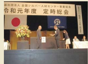
※全シ協=(公社)全国シルバー人材センター事業協会