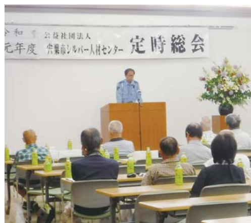
宍粟警察署より交通安全の講話