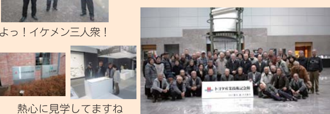
よっ！イケメン三人衆！