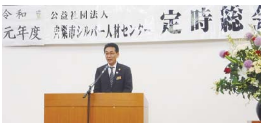
中村 司 副市長ご祝辞