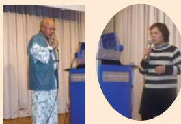
理事長もノリノリです