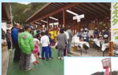
ちくさふれあい フェスタ