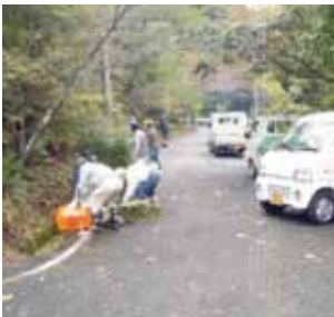
山崎事業所 平成25年10月30日 最上山公園周辺