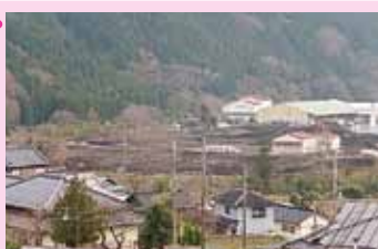
波賀町のタニナリエ