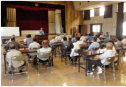
一宮・波賀事業所 (平成25年9月27日)