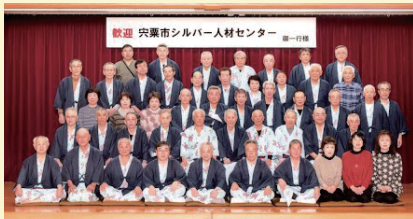
平成30年2月20日 宍粟市シルバー人材センター 道後温泉 ホテル椿館