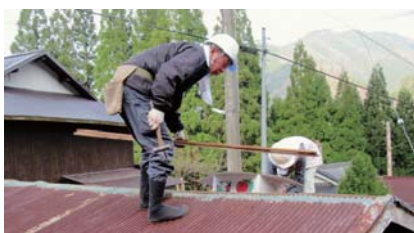
トタン屋根の葺き替え