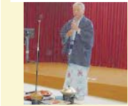
理事長のあいさつでスタート