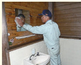
公園のトイレ掃除