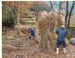
茅葺屋根の補修の為、秋に刈って保存しておきます

氷ノ山の草刈りは、ネマガリダケ（すすこ）の笹が登山道に被さり、その中をリュックサックを背負って、山頂まで刈り進んで行きます。