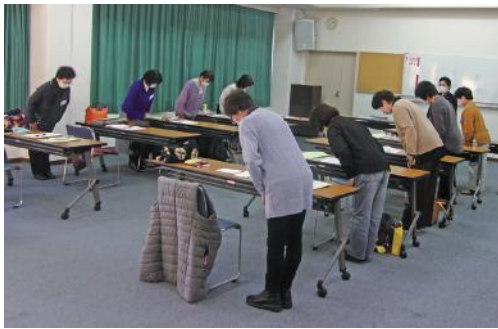
初日：お辞儀の練習、頭と背筋が一直線。

昨年12月22日から24日の3日間、女性限定「ときめくお洒落」講習会を山崎文化会館で行い、11人の参加がありました。