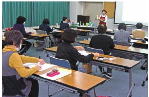
2日目：お掃除は楽しくてきれいに

受講者は「マナー講座では日ごろの行動をさりげない仕草一つで大きく印象をアップさせることができるようになりました。今日から心がけます」と笑顔で話していました。