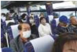
大型バス2台で出発です！

コロナ渦で行けなかった親睦旅行が4年ぶりに日帰りで開催され、80名の参加のもと賑やかにスタートしました！ 大型バス2台、市内各所で乗車し一路「淡路島海上ホテル」へ～！久しぶりの再会で話も弾み皆さんのテンションも急上昇です！