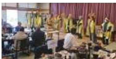
千種名物余興マツケンサンバ