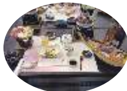
メニューはこちら