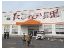
たこせんべいの里