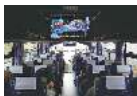
交通安全のDVD観賞も真面目にしました

初めての日帰りの旅、皆さんいかがでしたでしょうか？ 泊りと違って強行なスケジュールでしたが楽しんで頂けたでしょうか？ お疲れ様でした～。