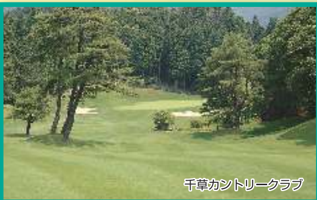
千草カントリークラブ

ゴルフ場から眺める満天の星空は、まるで宇宙の扉が開かれるような感動を味わえ、そこには数えきれないほどの輝く星々が広がり、静寂の中に漂う神秘的な雰囲気があります。