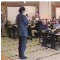
御馳走を前に理事長挨拶で宴会スタートです